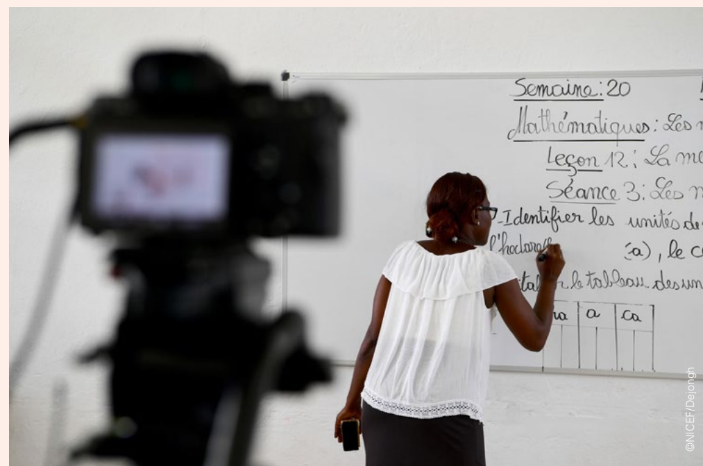
Una maestra prepara una lección que se graba en video para su transmisión en la televisión nacional.

En Costa de Marfil, UNICEF ha estado trabajando con el Ministerio de Educación en una iniciativa de “escuela en casa” que incluye la grabación de lecciones que se transmiten en la televisión nacional.